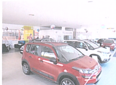
Considerando apenas o resultado de dezembro de 2017, houve um incremento de 3,22% nas vendas, em relação a igual mês do ano anterior